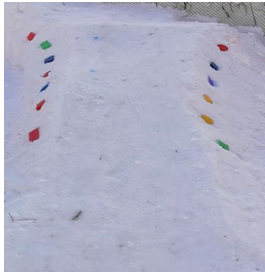
Катание с горки